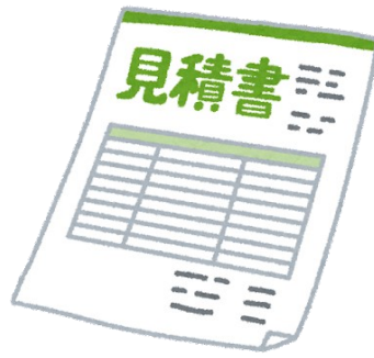
見積書 (相見積もり)