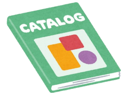
パンフレットカタログ