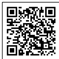
赤い羽根データベース はねっと