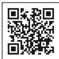
長野県共同募金会 ホームページ